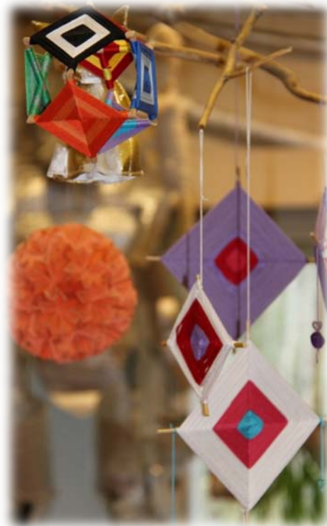
Vackra mexikanska kors hänger i taket