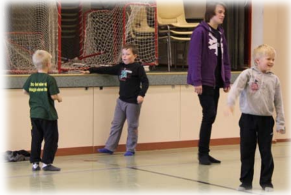
Innebandy och koda i gymnastiksalen är roligt och känns bra efter en skoldag!