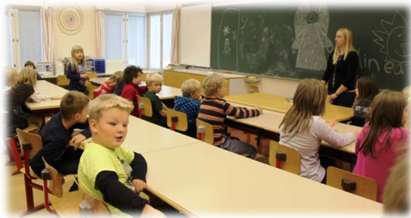
Samling med Ronja Rövardotter