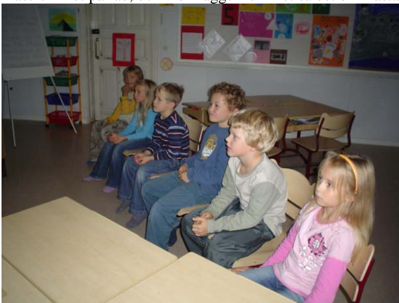
Filmen Ronja Rövardotter är spännande!