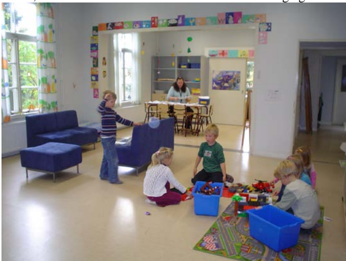
En av favoritsysselsättningarna är också att bygga med lego!